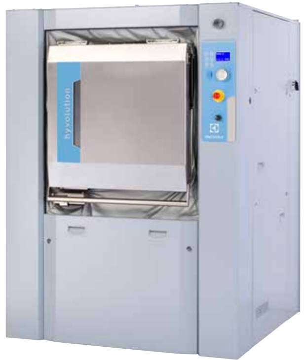
Images shown are a representation of the product only and variations may occur.